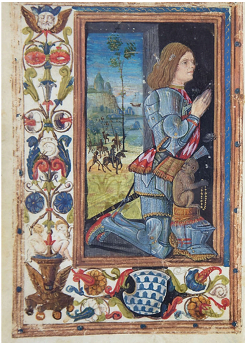
Fig. 1. Ms. 16, Biblioteca Fardelliana, Trapani, immagine del committente dell'offiziolo

Il primo volume è un elegante libro di preghiere private, un "libro d'ore", prodotto nella città francese di Rouen, uno dei centri più importanti per la miniatura medievale.